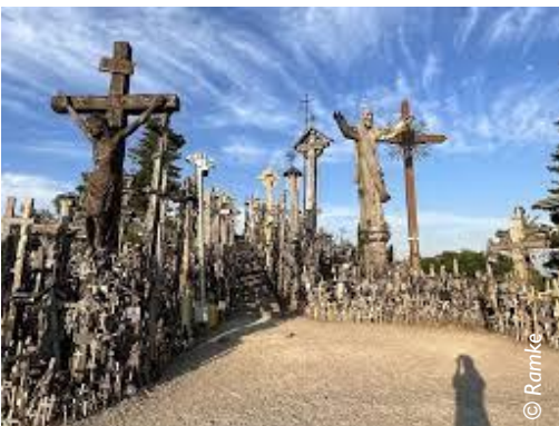
Berg der Kreuze in Litauen