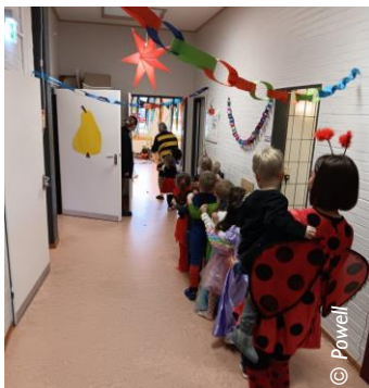
Polonaise mit den Kindern

Gemeinsam haben beide Kindergarten- gruppen am Rosenmontag Karneval gefeiert. Es wurden Masken gebastelt, es gab ein von den Eltern liebevoll ausgestattet Buffet, es wurde getanzt, gesungen und gelacht. Die Polonaise zum Abschluss durfte natürlich nicht fehlen.