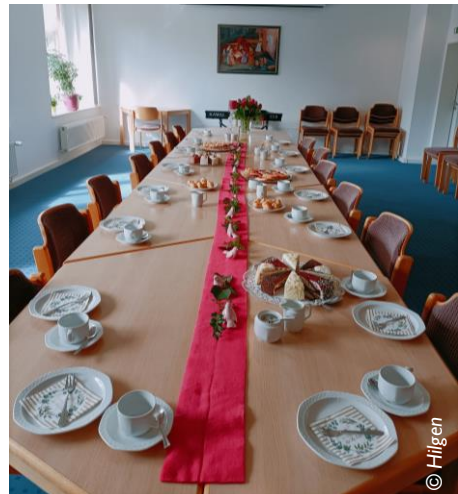
Kaffeetafel im Gemeindehaus